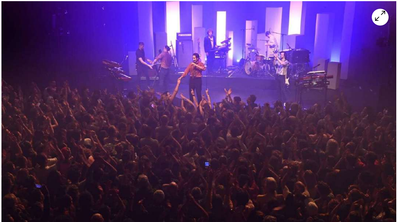
La foule des grands jours à Quai 9, à Lanester, pour le final en apothéose avec Feu ! Chatterton.

Samedi 13 novembre 2021, à Lorient (Morbihan), final en apothéose pour le festival les IndisciplinéEs avec Feu ! Chatterton. Avec 5 550 spectateurs, neuf des douze soirées affichant complet, une salle Hydrophone qui s'impose comme point névralgique, le festival a les clignotants au vert. Et voit ses efforts de « défricheur » récompenser.