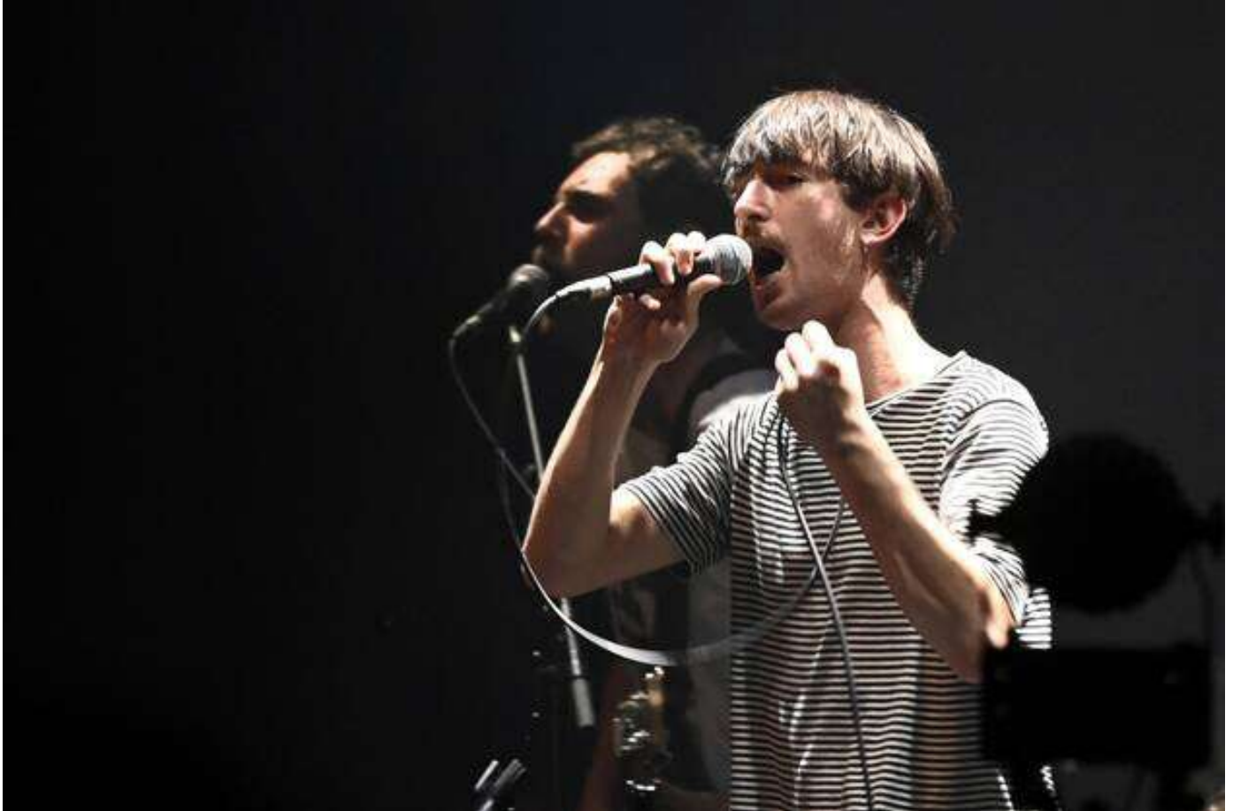
Les Bretons de Gwendoline : une scène underground régionale vivace et une confrontation de styles avec Feu ! Chatterton. Voilà qui crée la rencontre et non l'entre-soi...

C'est la force d'une programmation cohérente : dépasse le j'aime / j'aime pas. En invitant en première partie Gwendoline, reflet d'une scène underground vivace, on confronte les fans de Feu ! Chatterton à une musique dont ils n'auraient pas entendu parler. Même chose entre Famous et Thurstan Moore , entre Yseult et Thérèse : ça ouvre les écouteilles. Et sert le propos des Indisciplinés.