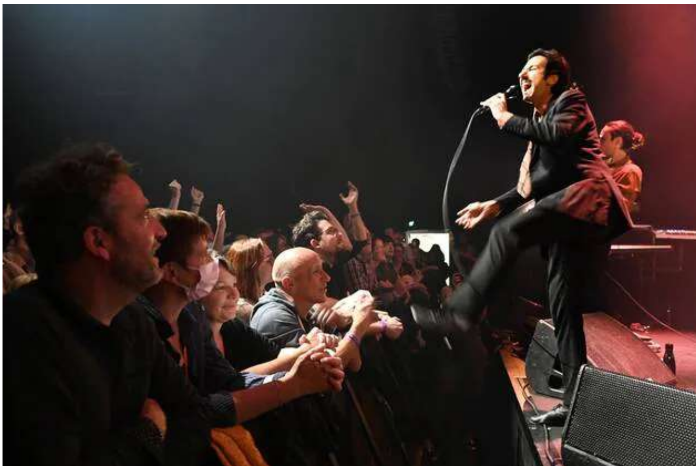
Ils connaissent l'esprit « IndisciplinéEs ». Feu ! Chatterton, c'est le meilleur antidote : deux doses de rappel, un public qui en redemande et le passe devient salubre...

L'équipe d'Hydrophone planchera sur les dossiers et s'appuiera sur le système de compensation mis en place par le Centre national de la musique. Côte artistique, le contexte sanitaire a joué sur les propositions : pas d'électro, pas de rap cette année avec en arrière-plan, le fait que les concerts pouvaient passer en mode assis s'il le fallait.